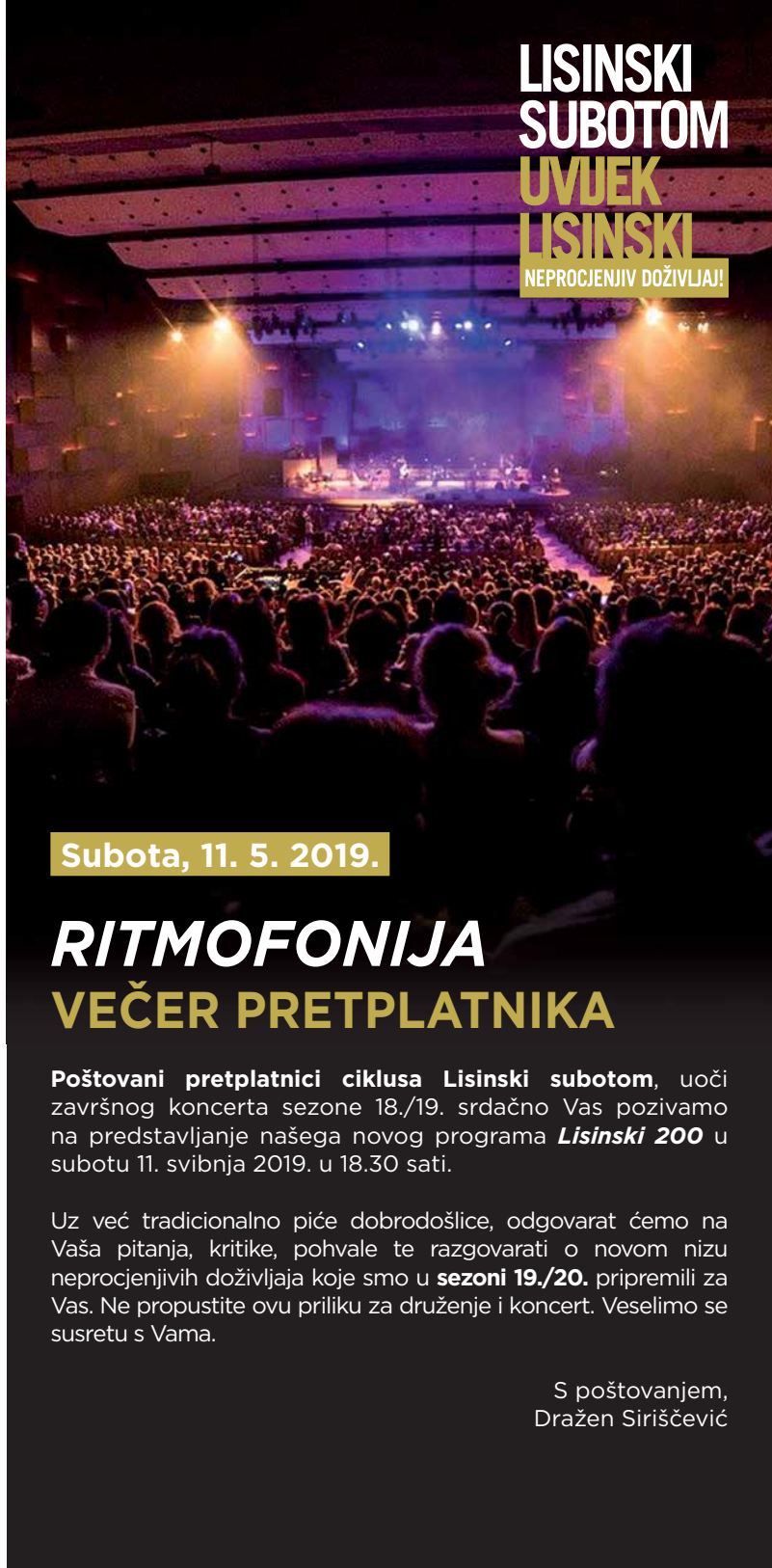
Dražen Sirišević ravnatelj

LISINSKI SUBOTOM UVJEK LISINSKI NEPROCJENJIV DOŽIVLJAJ!