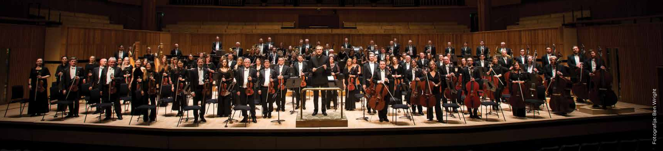
Fotografija: Ben Wright