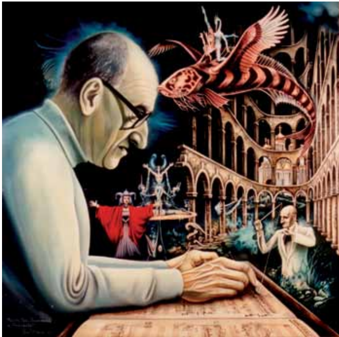
Paul Struck: Portret Borisa Papandopula