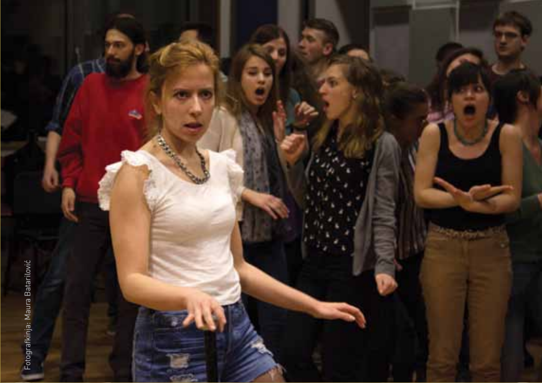
Fotografkinja: Maura Batarlović