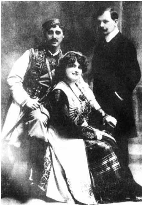
Louis Treumann, Mitzi Günther i Franz Lehár poslije praiizvedbe u Beču 1905.