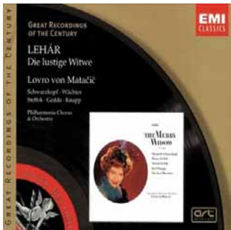
Snimka Vesele udovice za EMI